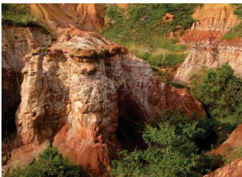
Le colorado auvergnat

Depuis Issoire, prendre l'A75 direction Saint-Germain-Lembron puis suivre Boudes (14,5 km). Parking sur la place du village puis suivre le balisage.