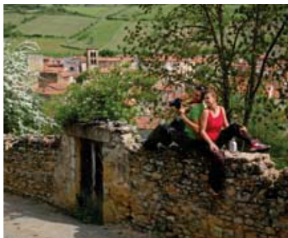
Le village et le vignoble de Boudes